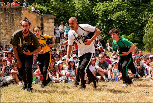
Carré-Colonnes – Festival Échappée Belle