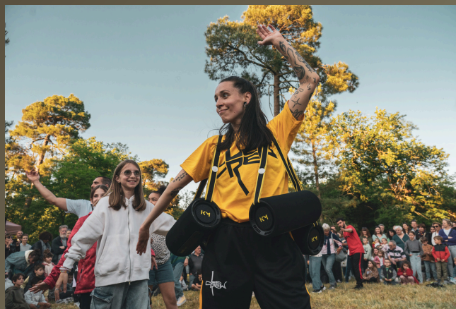
Carré-Colonnes – Festival Échappée Belle