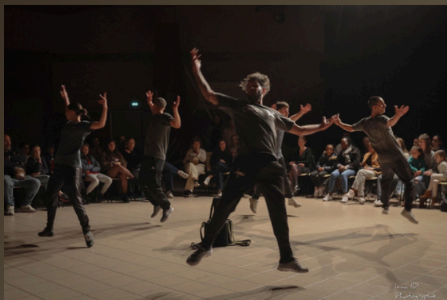
Parempuyre (en salle)