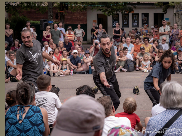
Chalon – Festival Chalon dans la Rue