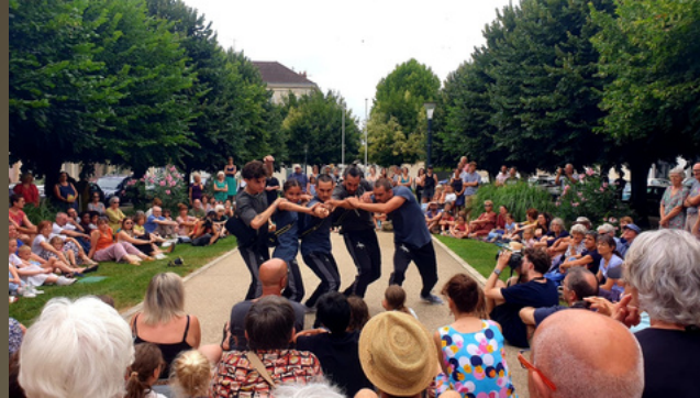
Périgueux – Festival Mimos