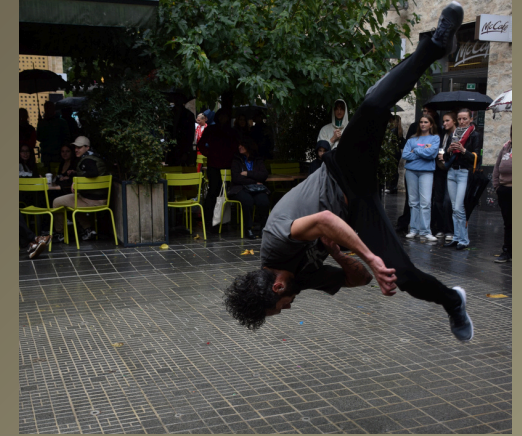
Bordeaux – Anniversaire de la Promenade Sainte-Catherine

Le Crew est un spectacle qui se joue dans tous les environnements : dans l'espace public (parc, rue, cour d'école, halle couverte...), ainsi qu'en intérieur (grande scène, salle des fêtes, gymnase...). Le Crew se joue de nuit comme de jour.